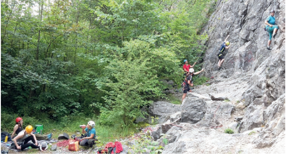
Klettern im Sauerland – Unterer Elberskamp