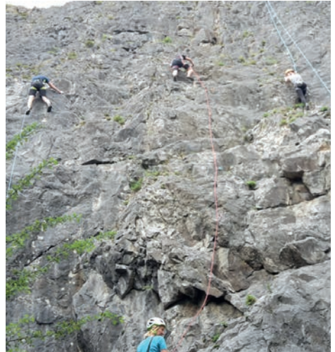
Mindestabstand gewahrt!

voran und probierten es aus. Die Rückmeldungen waren durchweg positiv. Der Bochumer Bruch (unser Sommerklettergebiet) sei verhältnismäßig leer und auch in der sonst oft überfüllten Kletterhalle könne man dank begrenzter Personenzahl sicher klettern. Das klingt doch verlockend!