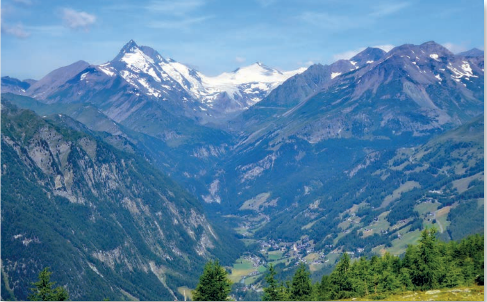
Blick zum Großglockner