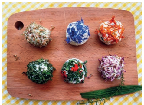
Friskäsebällchen mit Blüten

Wähle die Blüten mit unterschiedlichen Farben und Aromen. So hat nicht nur der Gaumen etwas davon, sondern auch das Auge.