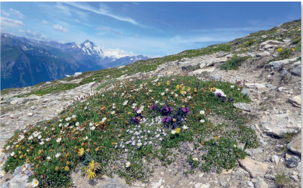
Seltene Blumen an der Stanziwurzten